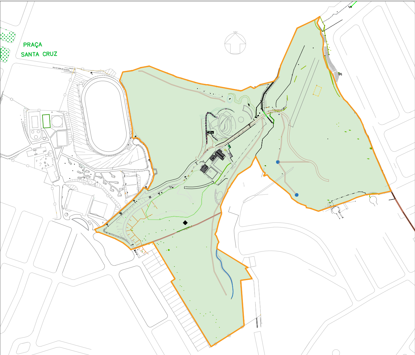
PLANTA DE SITUAÇÃO - JARDIM BOTÂNICO S/ ESC