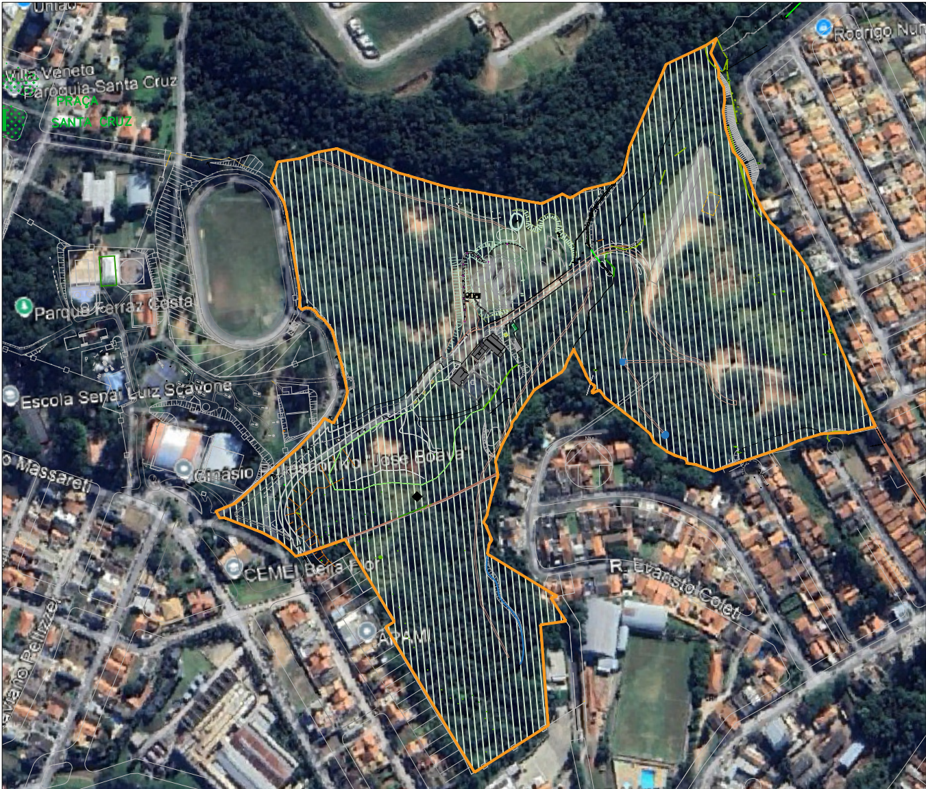
PLANTA DE SITUAÇÃO - JARDIM BOTÂNICO - SOBREPOSIÇÃO EM IMAGEM DO GOOGLE EARTH S/ ESC

OBS.: 1. A imagem apresenta distorção 2. Coordenadas: 22°59'56" S 46°49'50" O